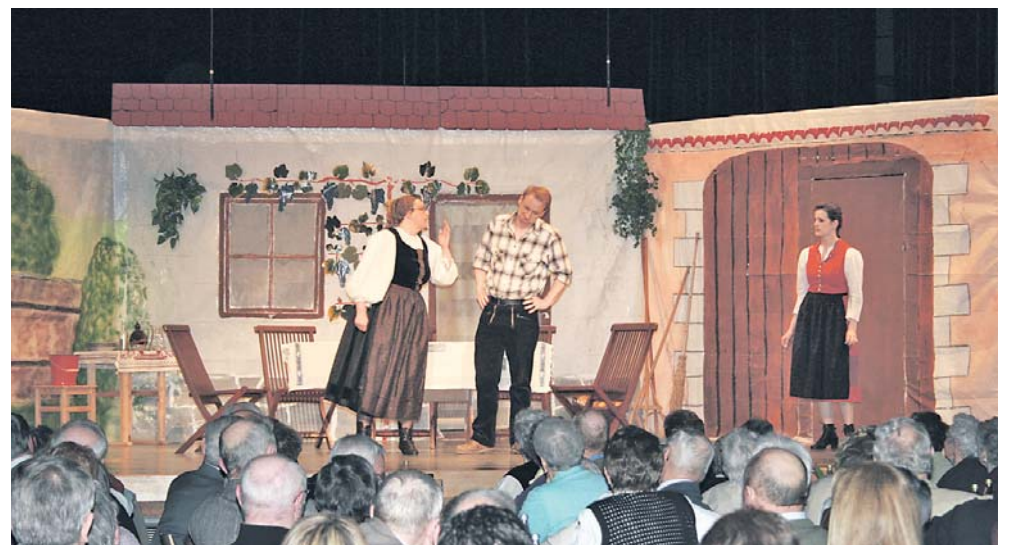
Die Theatergruppe Biberach beim kulturellen Nachmittag am 20. März in Sindelfingen-Mai-chingen.